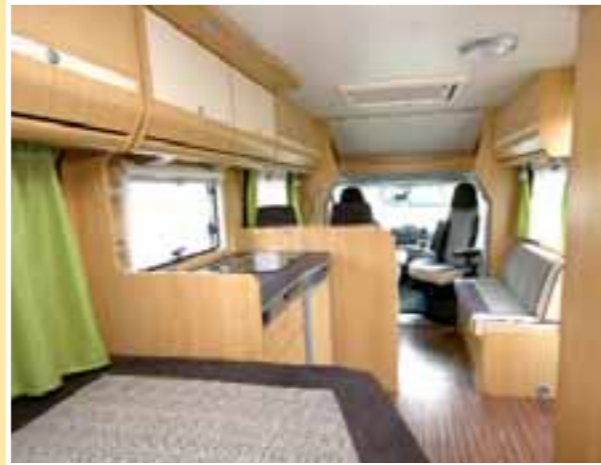
Hell und freundlich, auch von hinten betrachtet

ken Kaltschaummatratze gibt es nichts zu mäkeln. Ausreichend straff ausgelegt sorgt die Auflage für erholsamen Schlaf.