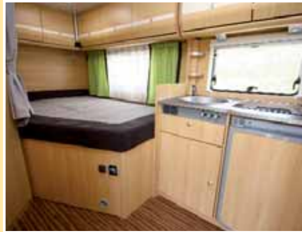
Viel Freiheit nach oben zeichnen den T 63 aus