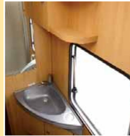
Das Waschbecken könnte größer sein