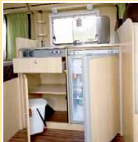
Ohne viel Chi-Chi: die Küche