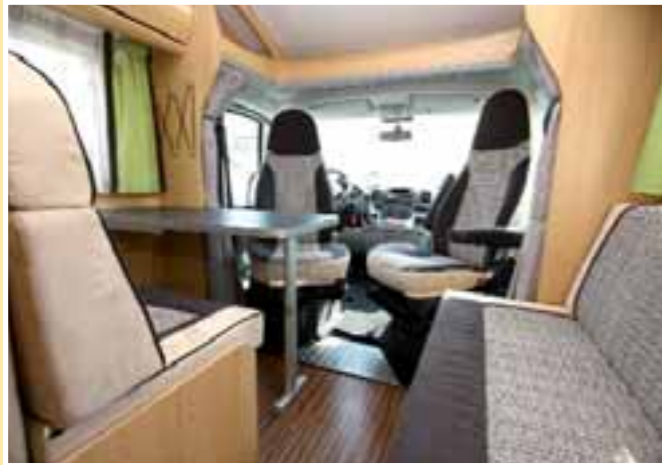
Gemacht für Sechser-Runden