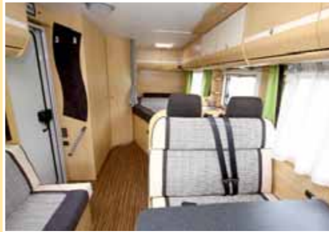
Lässt tief blicken: Der T 63 ohne Hochmobiliar