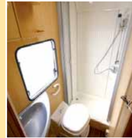
Geräumige Dusche mit Ablagedeckel