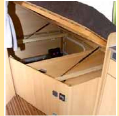
Praktisch ist der klappbare Lattenrost,

Die Beliebtheit des Fiat Ducato bei Reisemobilherstellern ist ungebrochen. Der Platzhirsch in Sachen Basisfahrzeuge scheint sogar in Zeiten weltwirtschaftlicher Talsohlen sein Revier permanent zu erweitern, und zumindest in Sachen Marktanteile immer mehr Prozentpunkte einzuheimen. Eine sicherlich nicht zu vernachlässigende Tatsache dabei ist, dass immer mehr Reisemobilhersteller im Einstiegssegment ihre Wohnaufbauten auf den beliebten Italo-Transporter setzen. Ursachen hierfür sind unter anderem, dass sich der Ducato seit langem bewährt, Fiat für Reisemobilisten einiges an Service bietet und das Fahrzeug sich in der Handhabung unkompliziert und zuverlässig darstellt. Wohl auch ein Grund, weshalb (nicht nur) Sunlight die eigene Fahrzeugflotte komplett nun auf den Platzhirschen und Bestseller ausrichtet.